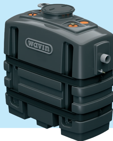
EuroREK NS2...NS7 SL -rasvanerotin